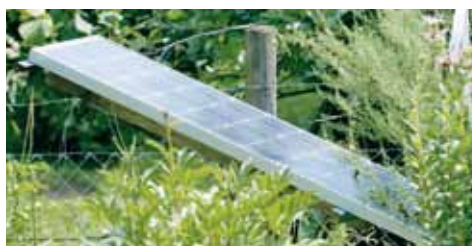
Das Restaurant Rose in Vellberg-Eschenau setzt auf Sonnenenergie – sowohl auf dem Dach als auch zum Betrieb der Teichpumpe im Kräutergarten.