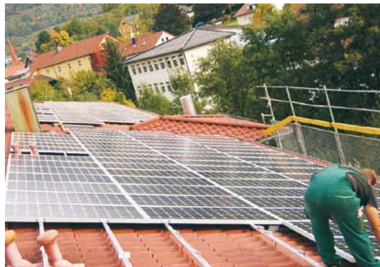
Solaranlage – Internat des Gastgewerbes in Bad Überkingen.

Eine Energieberatung durch die DEHOGA-Energieberatung in Stuttgart kostet ca. 500 Euro netto, ein Betrag, der sich mit vielen kleinen und nicht kostenintensiven Maßnahmen schnell einsparen lässt. Die Berater geben Ihnen hierfür wertvolle Tipps und Tricks.