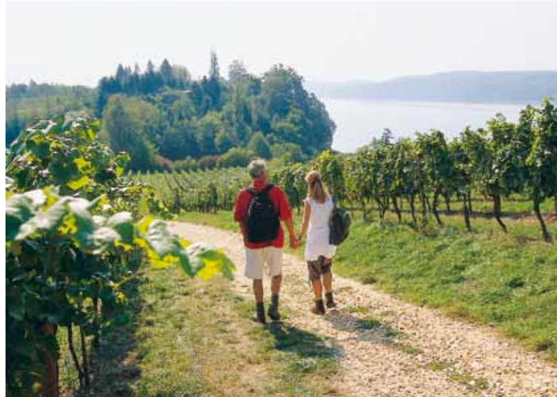
Erfolgreicher Tourismus setzt eine intakte Natur voraus.

Allgemeine Hinweise zu EMAS unter www.emas.de