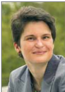
Tanja Gönner Umweltministerin Baden-Württemberg

Der Hotel- und Gaststättenverband DEHOGA Baden-Württemberg bekannte sich schon früh (1990) zu seiner umweltpolitischen Verantwortung.