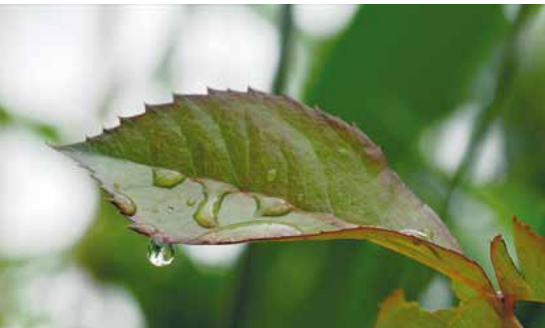
Die Nutzung von Regenwasser für die Toilettenspülung oder Waschmaschine ist kostensparend und umweltfreundlich.

Nach dem feuchten Sommer 2007 liegt die Vermutung nahe, dass der Wasserverbrauch durch die Bewässerung einer Hotelaußenanlage nicht hoch gewesen sein kann. Dennoch gibt es während des Jahres viele Zeiten im Frühjahr und Sommer, an denen aufwändig und kostenintensiv bewässert wird. Wieso also nicht den Regen in unseren Breiten nutzen? Wenige Gastronomen kennen ihren Wasserverbrauch für Blumenkästen oder Grünanlagen. Dabei wäre es sehr einfach, ihn zu schätzen. Zählt man die Anzahl der Gießkannen oder installiert am Außenwasserhahn einen kleinen Kaltwasserzähler (Kosten ca. 10 Euro), kann man gut schätzen, wie viel Wasser dort verbraucht wird.