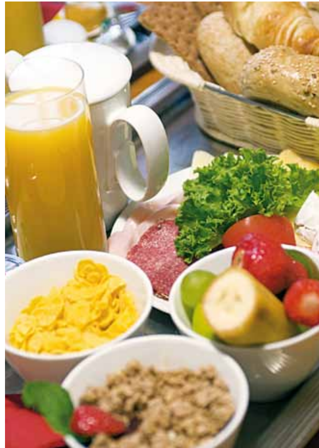
Abfall vermeiden durch den Verzicht auf Portionspackungen beim Frühstücksbüffet.

Für immer mehr Betriebe, deren Entsorgungskosten sich nach dem Abfallvolumen richten, werden auch so genannte Müllpressen oder Müllverdichter interessant. Auf diese Weise kann das Abfallvolumen um bis zu 75 % reduziert werden, mit der Folge, dass entweder weniger Abfallabfuhrungen oder auch kleinere Müllcontainer nötig werden. Die Maßnahme der Müllverdichtung muss jedoch mit der jeweiligen Entsorgungsfirma abgesprochen werden. Ob sich die Investition in eine solche Müllpresse lohnt, kann anhand einer einfachen Kosten-Nutzen-Analyse geklärt werden. Im Folgenden werden die Beispiele eines kleinen 2-Sterne-Betriebes und eines großen 4-Sterne-Betriebes beschrieben.