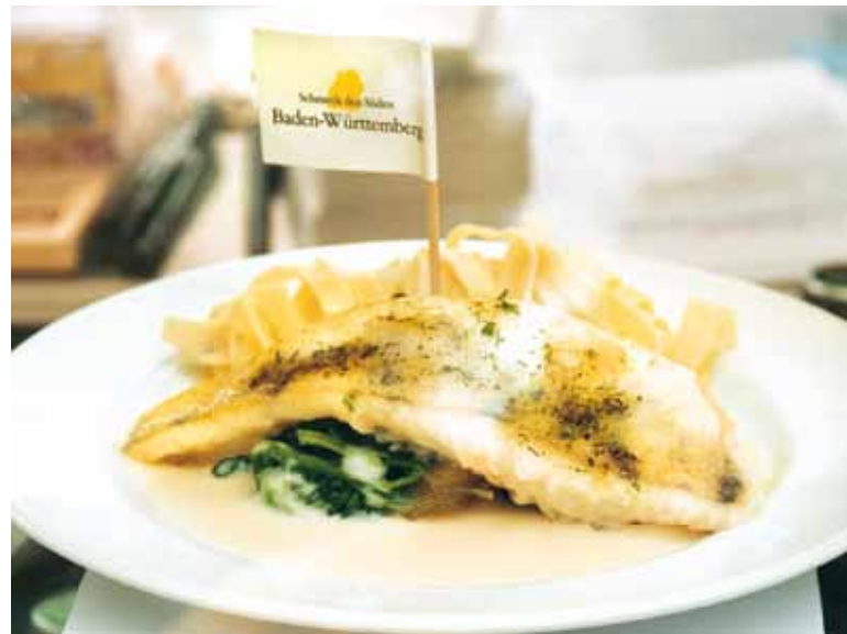
Die Verwendung regionaler Produkte stärkt die Landwirtschaft vor Ort und verbessert durch kurze Transportwege die Öko-Bilanz.

Ein UMS sieht auch vor, die Organisationsstruktur, die Hauptverantwortlichkeiten sowie die Verfahrensabläufe des Betriebes zu dokumentieren und festzuhalten. Dies beinhaltet u. a. die Benennung eines Umweltmanagementbeauftragten, die Erstellung von Verfahrens- und Arbeitsanweisungen, den Aufbau eines Notfall- und Gefahrstoffmanagements mit Hilfe von Notfallplänen und Betriebsanweisungen, die Erstellung von Schulungsplänen und die Dokumentation ihrer Durchführung. Ein besonderer Schwerpunkt sollte dabei auf die Bewusstseinsbildung der Mitarbeiter gelegt werden. Der Erfolg oder Misserfolg bei der Umsetzung eines Umweltmanagementsystems hängt nicht nur von der Unternehmensleitung, sondern maßgeblich auch von der Motivation der Belegschaft ab, denn letztlich sind es die einzelnen Mitarbeiter, die durch ihre Handlungsweisen die Umwelleistung des Betriebes ausmachen.